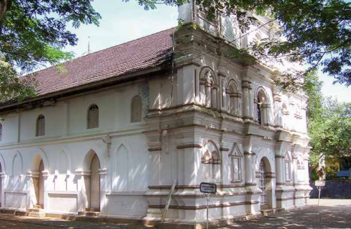
Maramon Mar Thoma-kerk

heeft, betekent dit bijvoorbeeld nog lang niet dat ze de inhoud van de daar vastgelegde leer niet toch leert en leeft. Bij dit alles vormde het gemeenschappelijke uitgangspunt van oud-katholieken en Mar Thoma Syrian gelovigen in de vroege kerk een cruciale bron; de herontdekking en herwaardering van de Syrische traditie in beide kerken in de afgelopen vijftig jaar is hierbij een belangrijk hulpmiddel (zie in het oud-katholiek kerkboek bijvoorbeeld het gebruik van de anafora van Addai en Mari als één van de twaalf eucharistische gebeden).