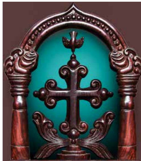
Mar Thoma Sliva of St. Thomaskruis

Toch zijn deze antwoorden, of ook nog andere,