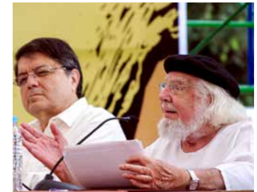
Bevrijdingstheoloog Ernesto Cardenal in 2010

Anderen leken van weeromstuit hun beeld van een zachte, lieve God tot een zeer actieve God bij te stellen. Geen theologie van 'Stil maar, wacht maar, alles wordt nieuw', maar een 'bevrijdingstheologie'.